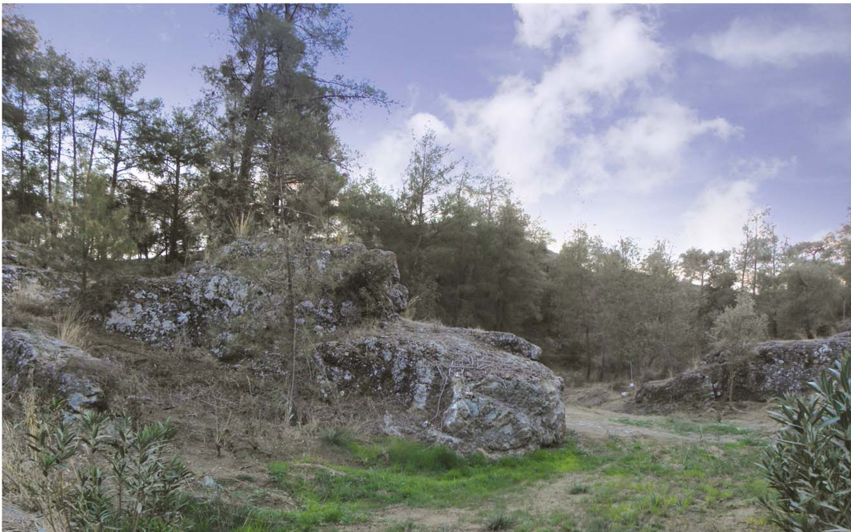
▲ Τα σπάνια ηφαιστειογενή πετρώματα του Δελίκηπου