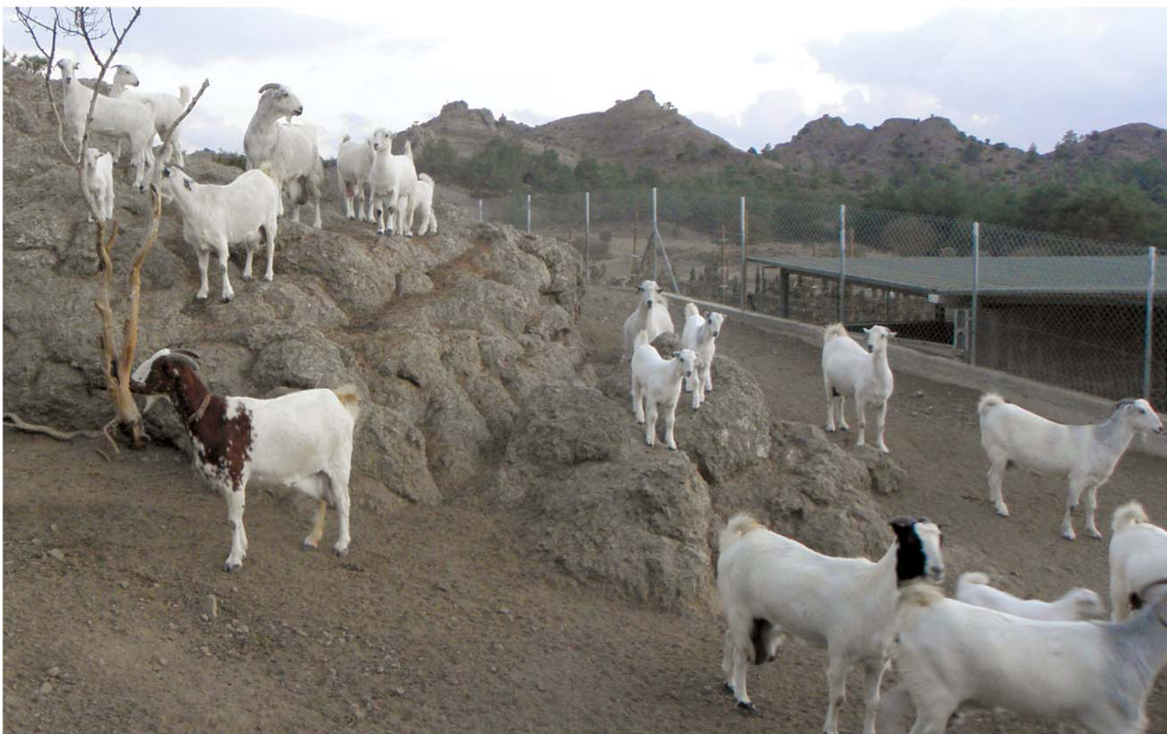
▲ Η ενασχόληση με την κτηνοτροφία