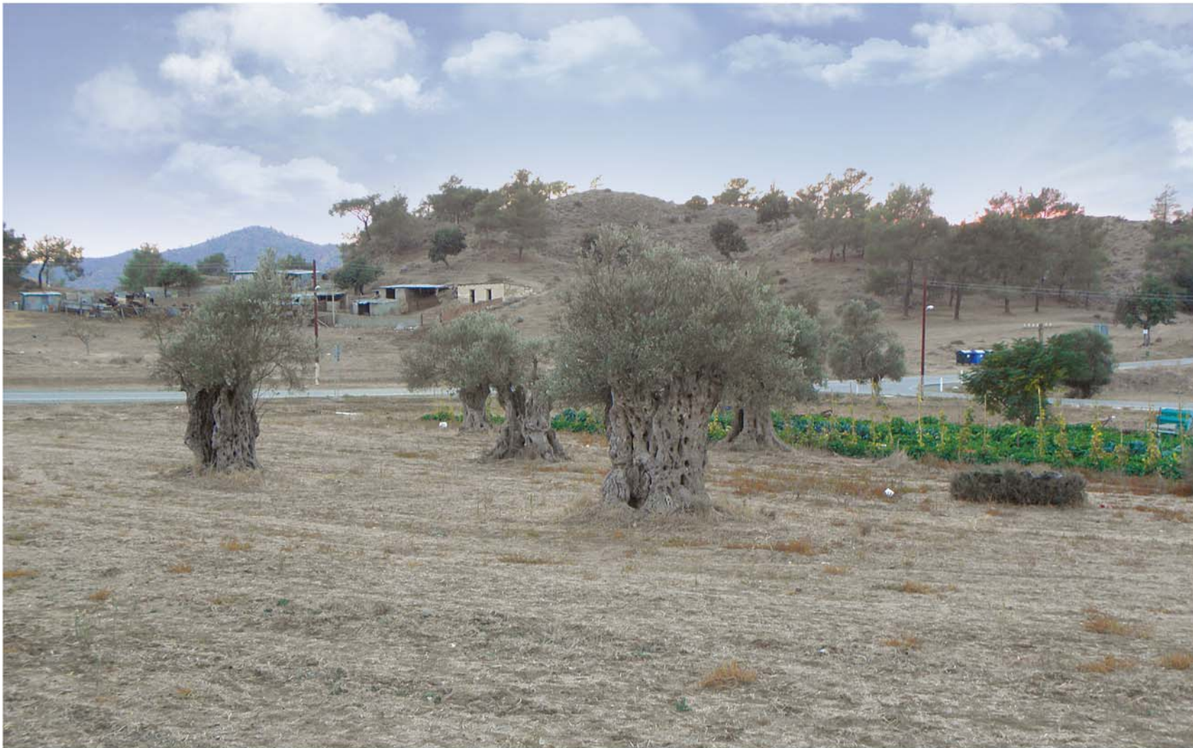
▲ Οι αιωνόβιες ελιές του Δελίκηπου.