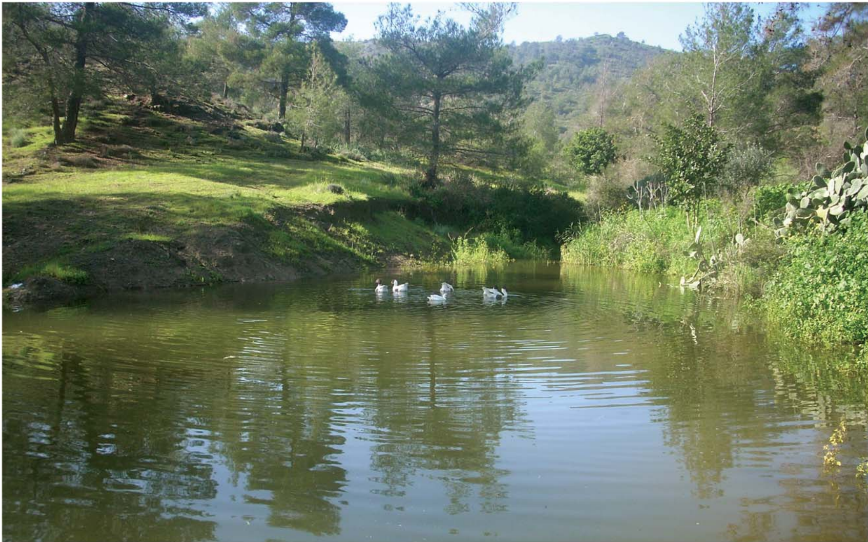
▲ Μια όμορφη λίμνη με πάπιες στην αγκαλιά άγριας βλάστησης