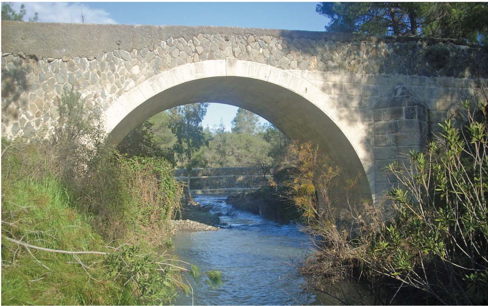
▲ Το πέτρινο Διπλογέφυρο στον ποταμό του Μύλου