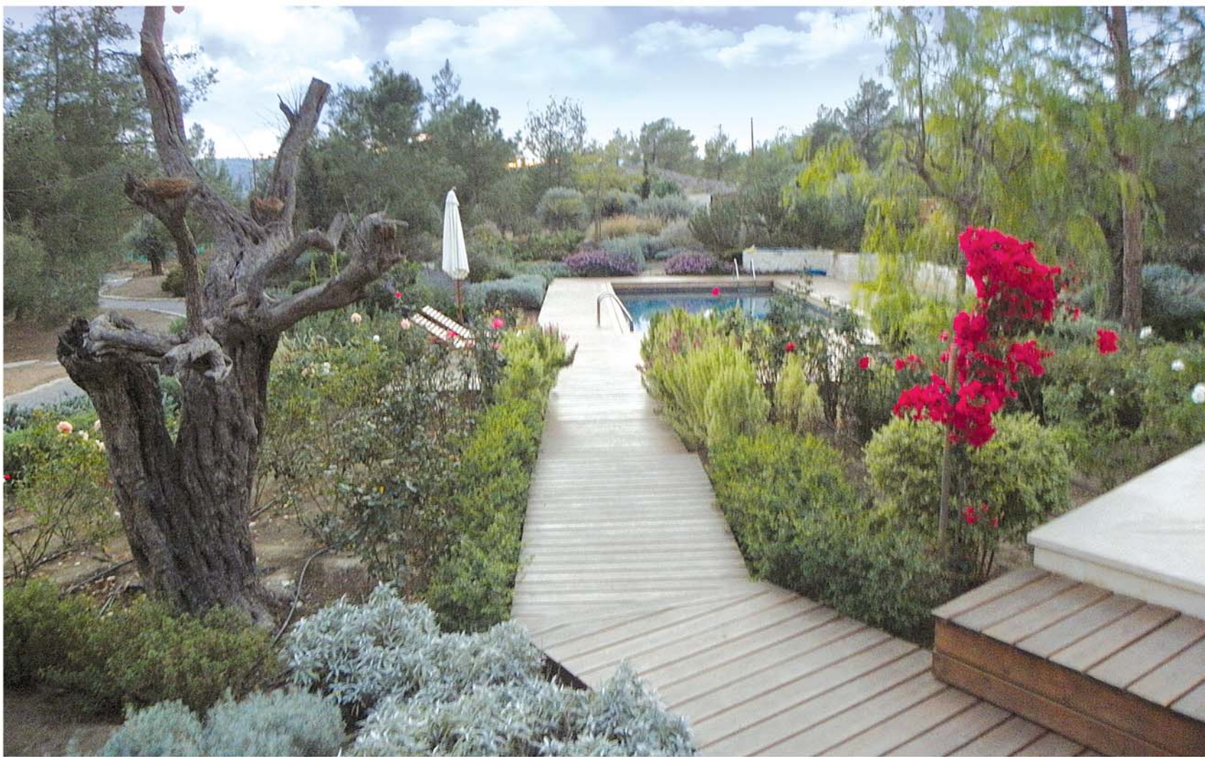
▲ Ένας από τους περιποιημένους κήπους της κοινότητας.