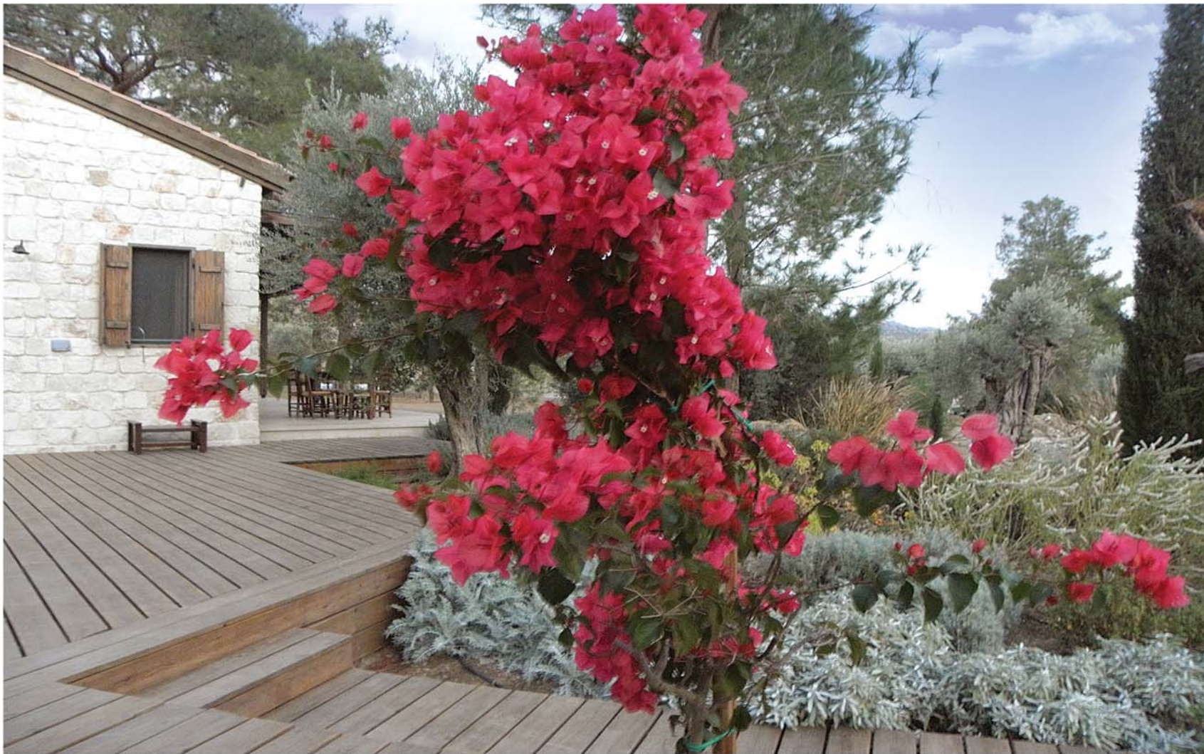
▲ Στους κήπους του Δελίκηπου ανθίζουν όμορφα λουλούδια.