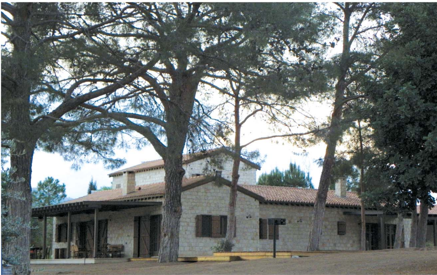
▲ Οικιστική ανάπτυξη των τελευταίων χρόνων