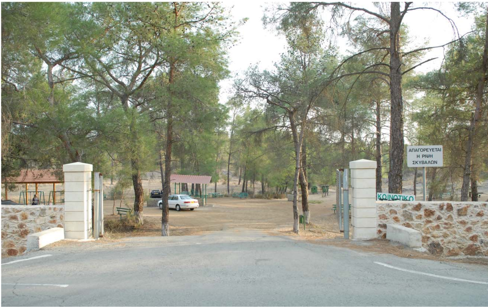
▲ Κοινοτικό Πάρκο