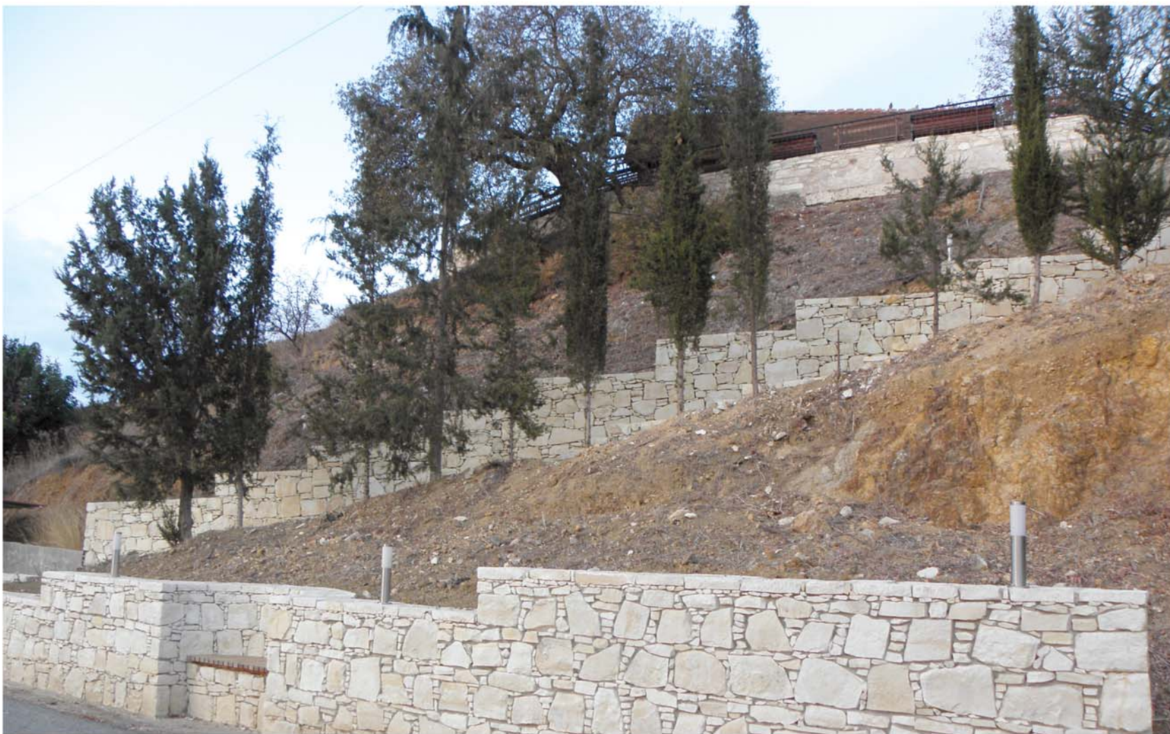
▲ Ένα από τα αναπτυξιακά έργα που έγιναν στο Δελίκηππο τα τελευταία χρόνια.