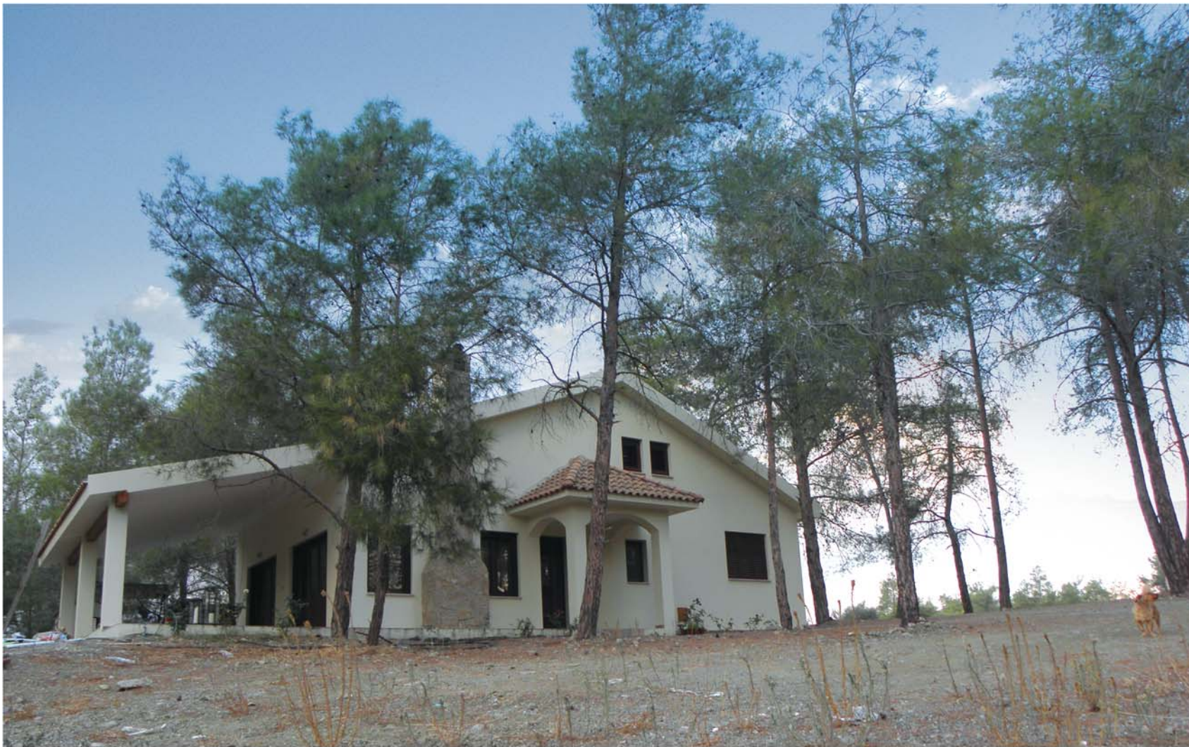
▲ Οικιστική ανάπτυξη των τελευταίων χρόνων