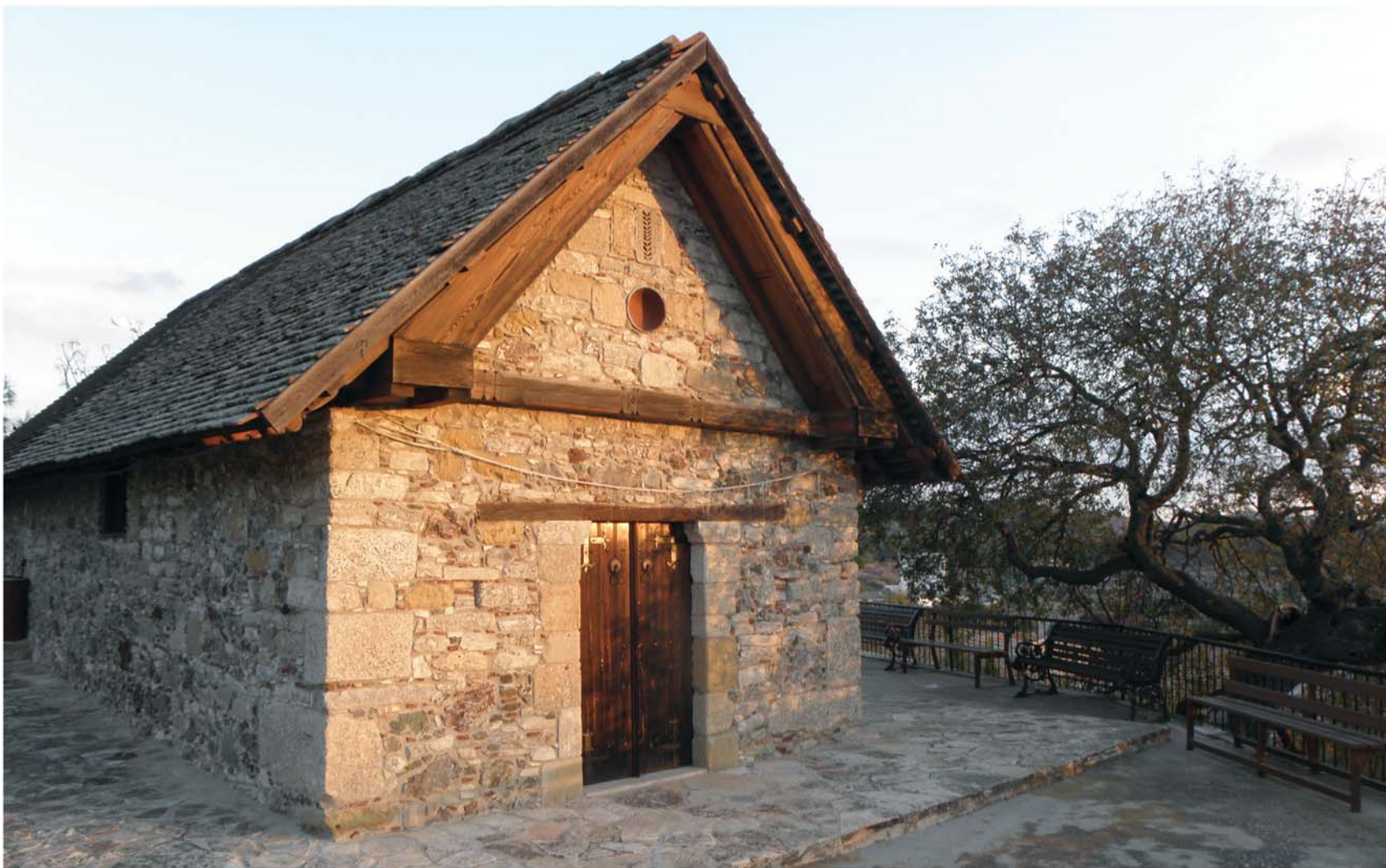
▲ Η εκκλησία Μεταμορφώσεως του Σωτήρος που κηρύχθηκε Αρχαίο Μνημείο.